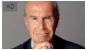
Dieta "mima-digiuno": la scienza conferma utilità per... ProLon