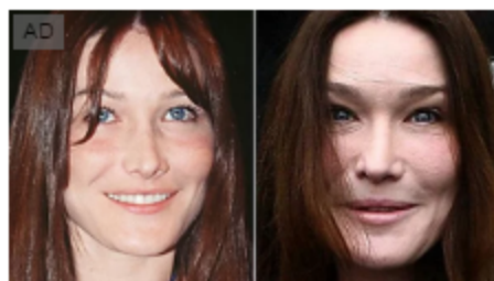
10 bellezze rovinare dal bisturi (FOTO) Hitparade