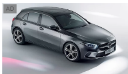
Nuova Classe A 180 d. Guida l'intelligenza. Anche con extra... Mercedes-Benz