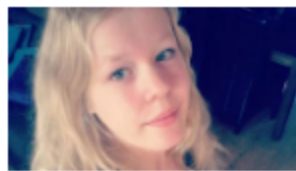
Noa si è lasciata morire. Papa, una sconfitta per tutti...