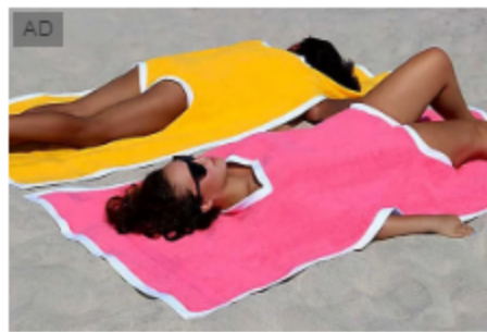
Il nuovo must-have dell'estate si chiama towelkini Glamour