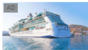
Come le navi da crociera riempiono le loro cabine... Crociere | Sponsored Listings