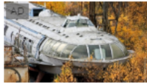
I più incredibili luoghi abbandonati del mondo Editor Choice