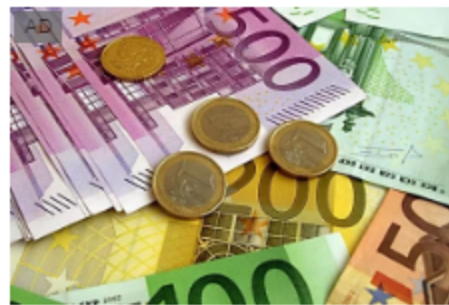
Azioni Amazon: un investimento che può farti guadagnare ogni mese Vici Marketing