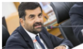
Bufera sulle Procure, incontri in hotel per decidere le...