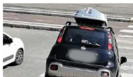
Scende con auto da scalinata in centro Roma