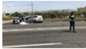
Auto contro mezzo pulizia, muore 27enne