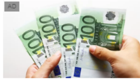
Guadagnare un secondo stipendio al mese investendo su Amazon Vici Marketing