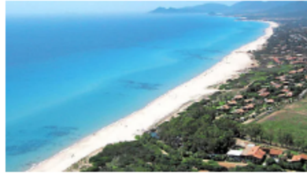
Turista muore in spiaggia Sardegna - Cronaca