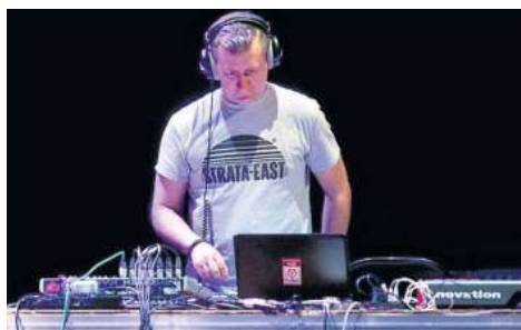
Il deejay, musicista e producer Dj Rocca

Riproposta la formula delle performance a notte fonda ma anche appuntamenti riservati ai più piccoli