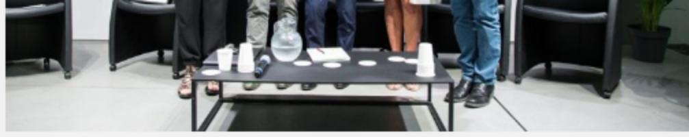
Premio Cultura in Verde per Time in Jazzncora tanti