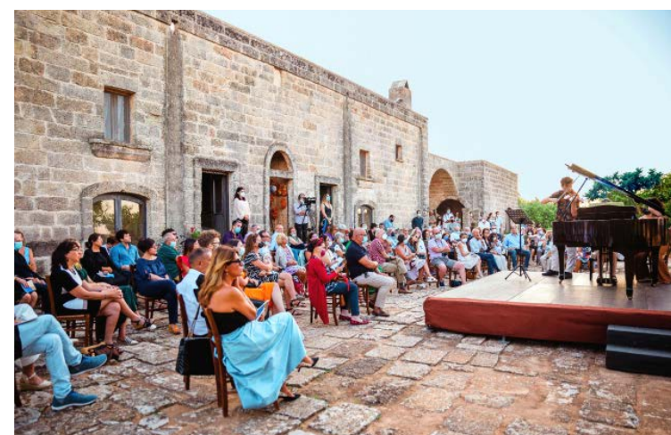
MUSACCHIO IANNELLO PASQUALINI, SALVINO

Palme alte e possenti e la mole imponente degli edifici di epoca fascista. Sono gli elementi che caratterizzano il lungomare Vittorio Emanuele II, sede della rassegna tarantina. La vasta rotonda è il punto più panoramico dal quale lo sguardo può arrivare fino ai monti calabresi. La perla del cartellone è rappresentata dagli Echo & the Bunnymen (unica data italiana). Alfieri del rinascimento di Liverpool negli anni Ottanta, Ian McCulloch e compagni hanno vissuto la transizione dal post-punk a un pop psichedelico di grande suggestione e