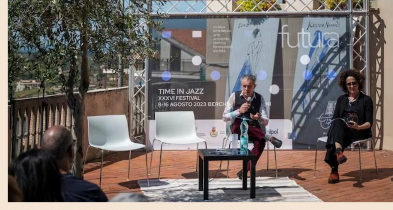
▲ Paolo Fresu presenta la 36esima edizione di «Time in Jazz»

Ascolta la versione audio dell'articolo 3' di lettura Sarà ancora una volta denso di eventi e variegato di proposte non solo musicali l'appuntamento della prossima estate con Time in Jazz. Alla sua trentaseiesima edizione, il festival ideato e diretto da Paolo Fresu si snoderà come sempre tra la sua Berchidda (Sassari) e gli altri centri del nord Sardegna dove farà tappa con la sua carovana di concerti, trovando ogni volta scenari differenti, tra borghi, paesaggi campestri e scorci marini: Arzachena, Banari, Bortigiadas, Buddusò, Budoni, Cheremule, Loiri Porto San Paolo, Luogosanto, Mores, Oschiri, Porto Rotondo, Puntaldia, San Teodoro, Tempio Pausania e Tula. Appuntamento dall'8 al 16 agosto. Time in Jazz si presenta quest'anno nel segno di Futura , titolo e spunto presi in prestito dall'omonima canzone di Lucio Dalla, con l'idea di abbracciare idealmente diverse età; perché, spiega Paolo Fresu, «Futura è un progetto d'amore sognato con la complicità di un muro innalzato da due superpotenze che, nonostante tutto, non cancellano quel bisogno di emozione e di pathos nonché di condivisione che alimenta le nostre vite. Un bisogno che permea e attraversa le differenti generazioni alle quali vogliamo dedicare il tema di questa edizione. Lo facciamo utilizzando lo strumento che meglio conosciamo: la musica».