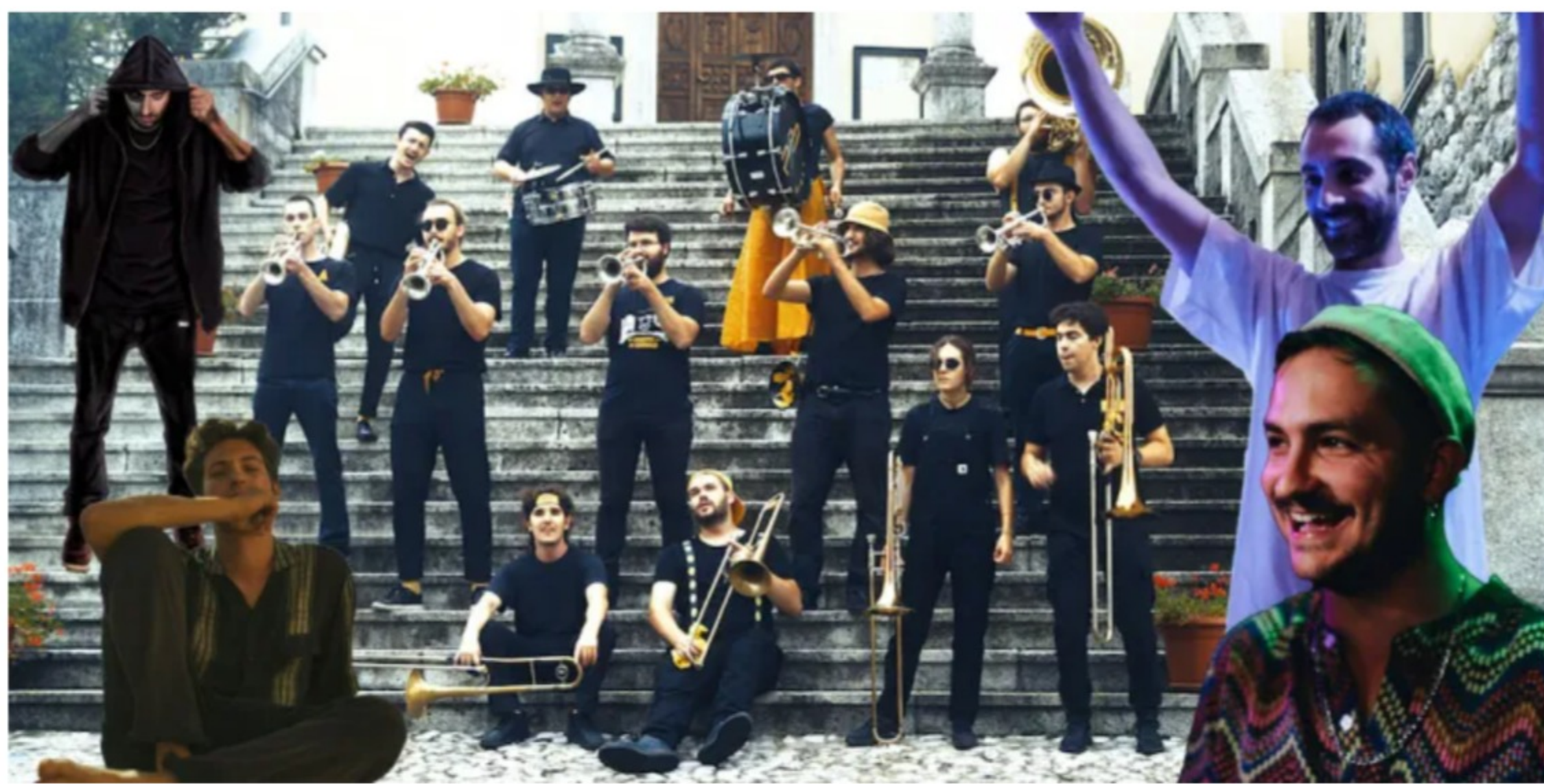
Time After Time al Time in Jazz