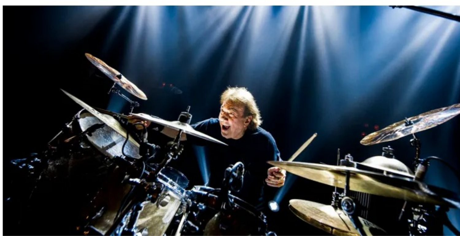
Tullio De Piscopo