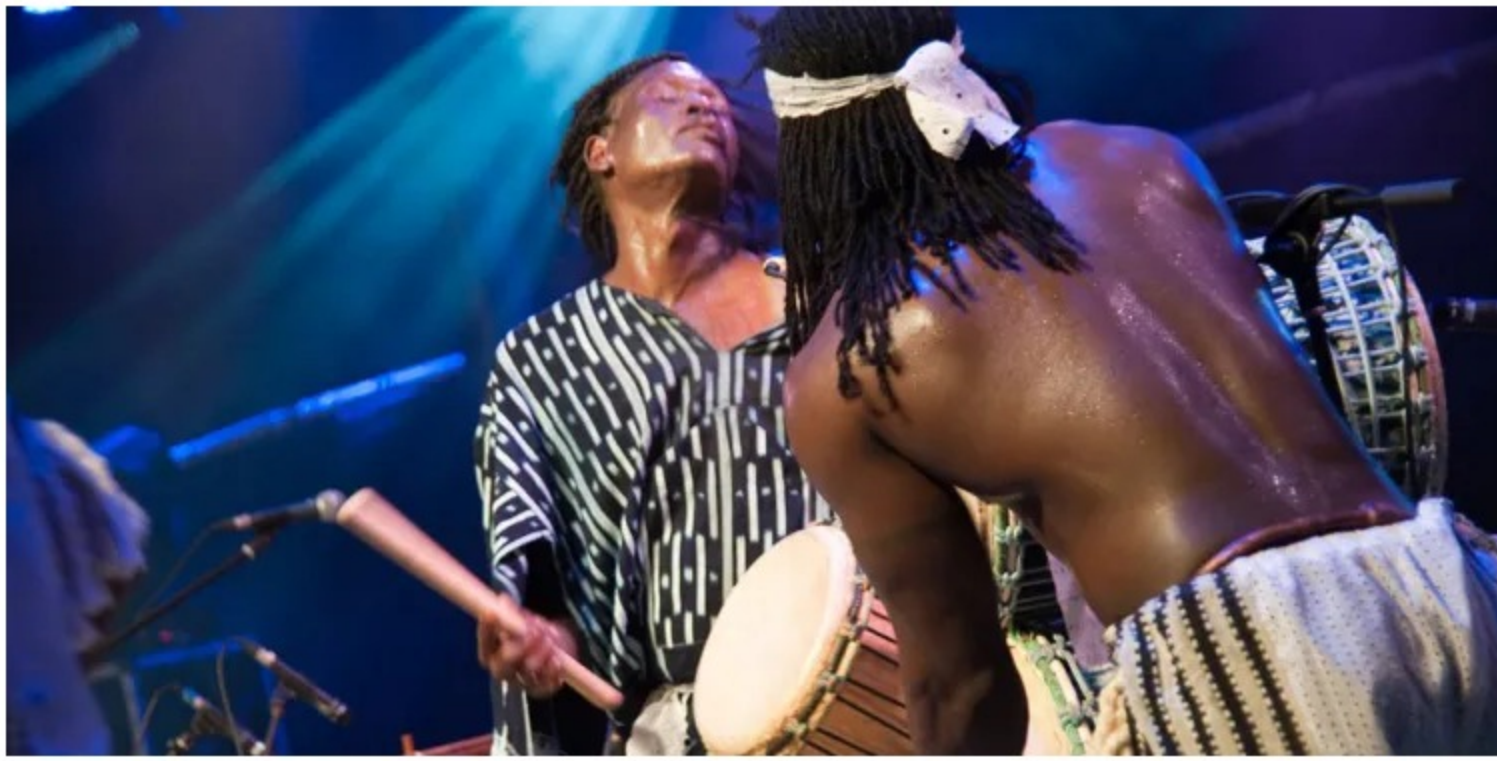
Farafina - Suchen SK

di Redazione — 13 Aprile 2023 in Eventi, Musica, Sassari 2 MINUTI DI LETTURA 46 0